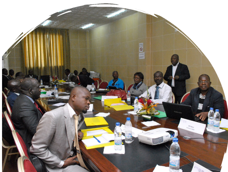
* Réunion du Comité de pilotage